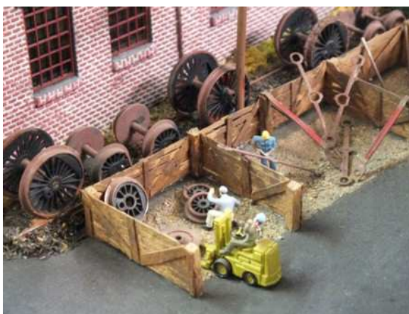
Schrottplatz am Lokschuppen