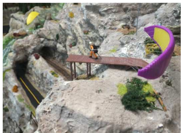
Gleitschirmflieger am Start