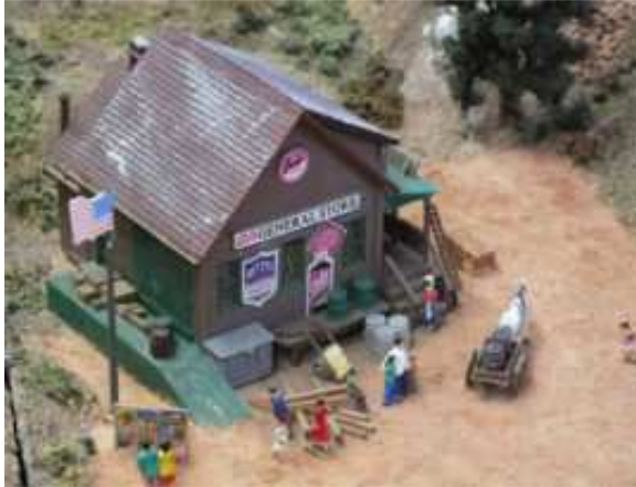
Einkauf auf dem Lande