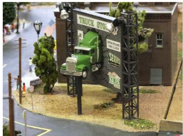
Werbung für eine Truck-Stop